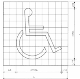
GRAFICO DEL "SIA"

Color Fondo: Azul Pantone Reflex Blue Símbolo: blanco